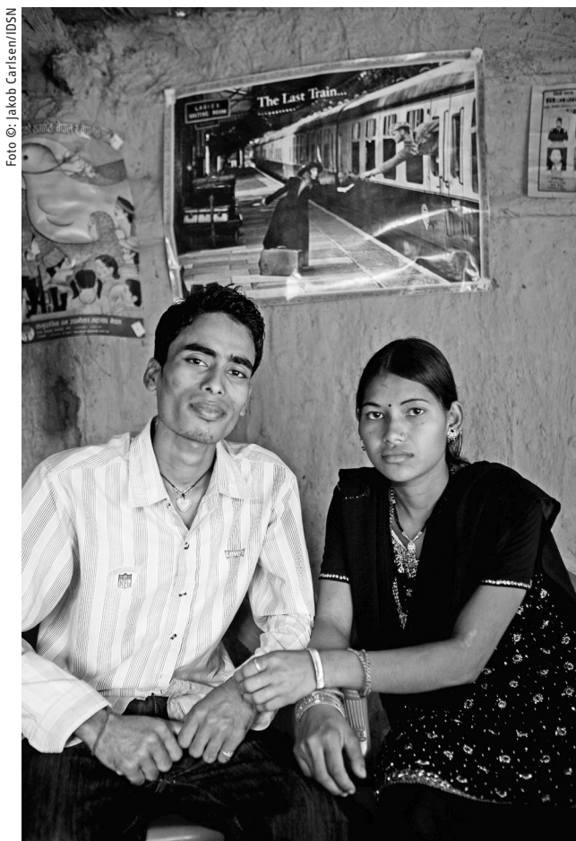
Zwei, die es wagen: Heirat trotz unterschiedlicher Kasten